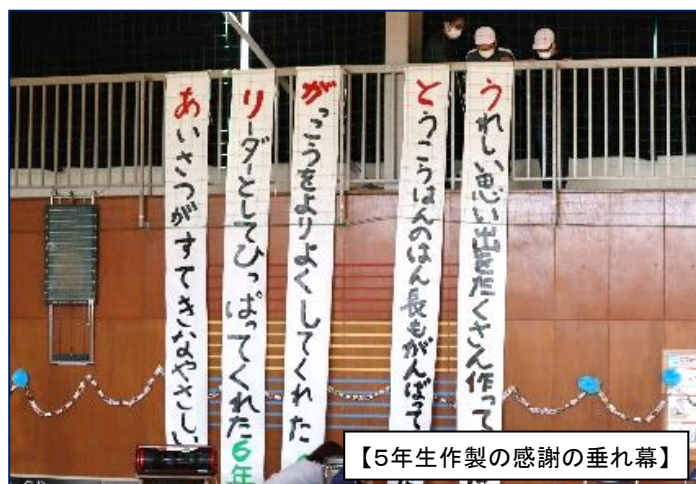
【5年生作製の感謝の垂れ幕】