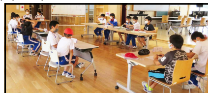
代表委員会での審議