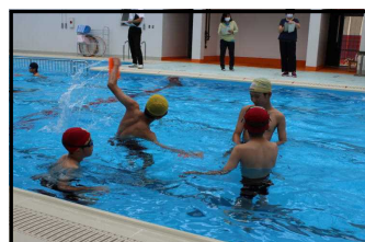
こうするといいよ

翌9月1日（水）、5・6年生の体育（水泳）の研究授業を行いました。「自分の課題を設定して、その解決に向けてグループごとにアドバイスし合う。」という授業でした。みんな真剣に友達の泳ぎを見ながらアドバイスしていました。こうやって、互いに成長していくのですね。