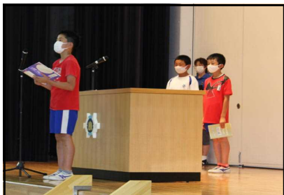
プール、6年間ありがとう

8月31日（火）、プールおさめを行いました。各学年代表から、感想、今年度の目標達成状況や来年度の目標を発表し