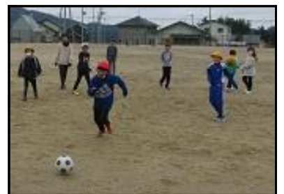
元気なサッカー少年少女