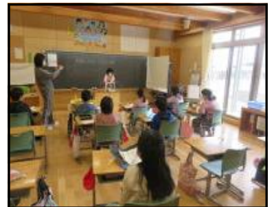
盛り上がる発表会

中休みには寒さをもものともせず、校庭で遊んでいる子がたくさんいました。『本気』『優気』『元気』の気仙小が戻ってきました。3学期、頑張りましょう。