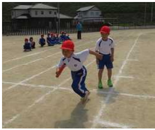
大注目の 全校リレー