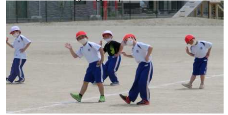
かわいい、そして かっこいい YOASOBI