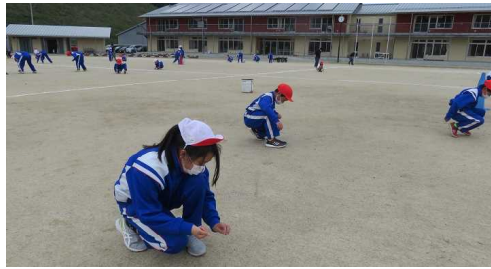
安全な競技のための石拾い