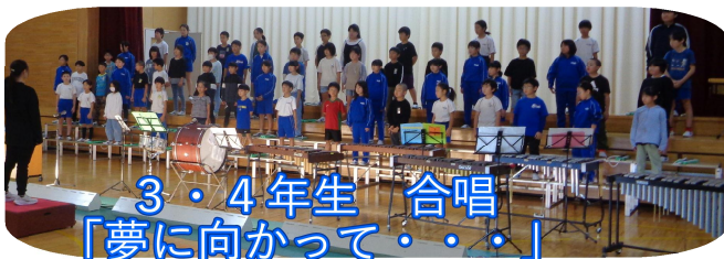
3・4年生 合唱 「夢に向かって・・・」