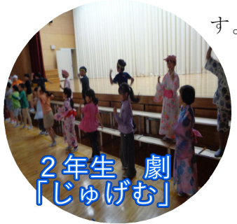
2年生 劇 「じゅげむ」