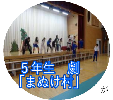
5年生 劇 「まぬけ村」