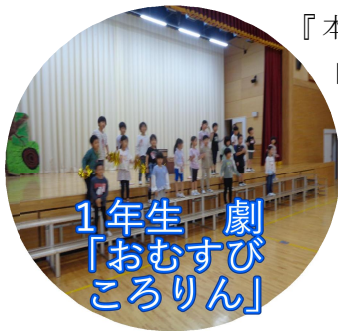
1年生 劇 「おむすびころりん」

保護者や地域の皆さんには、その成果をぜひ、みていただきたいと思えます。乞う、ご期待!