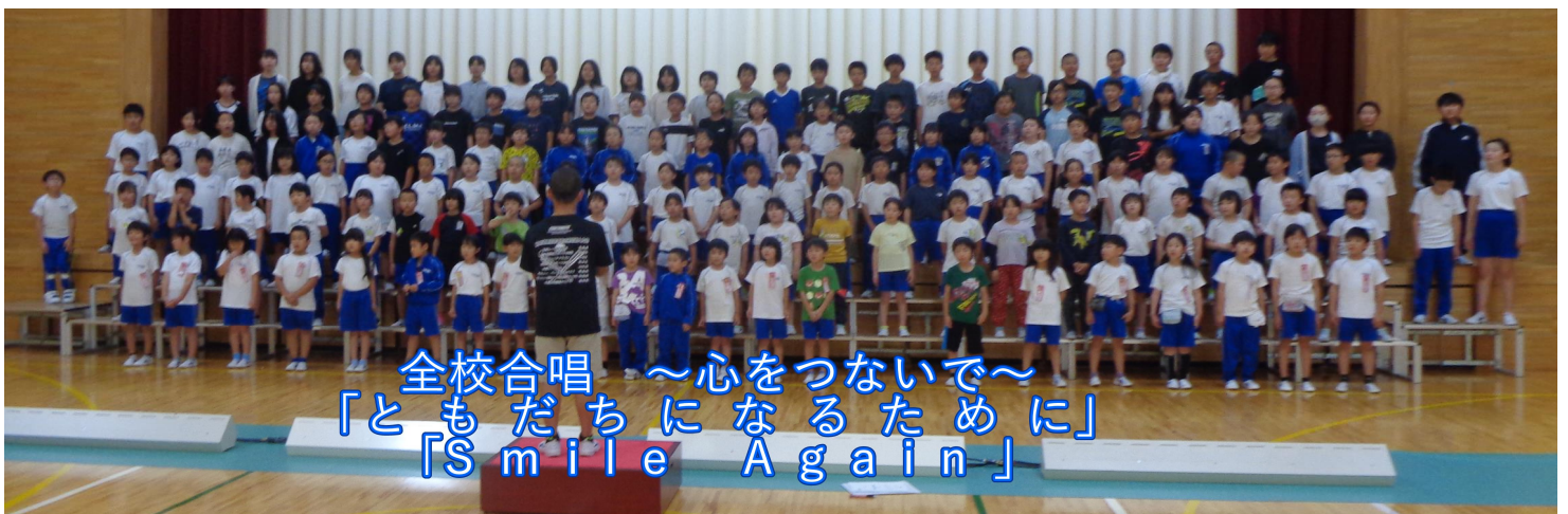
全校合唱 ～心をつないで～ 「ともだちになるために」 「Smile Again」