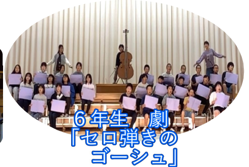
6年生 劇 「ゼロ弾きのゴーシュ」