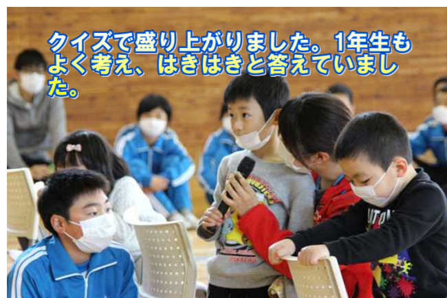
クイズで盛り上がりました。1年生もよく考え、はきはきと答えていました。

今年は残念ながら在校生の参加もなく、いつもより、やや寂しい入学式でしたが、1年生を迎える会では、7名の1年生を2年生から6年生のお兄さん、お姉さん一人一人が笑顔で迎えることができました。また、1年生も明るく元気に会に参加できました。