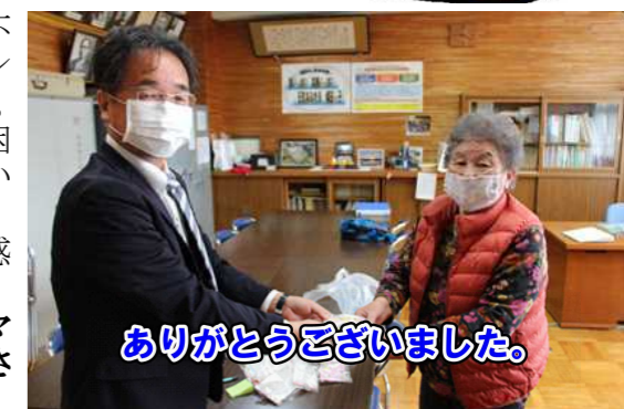
ありがとうございました。

今回の連休は、基本的に家で過ごすことになります。手作りマスクに挑戦してみようかなと思っています。お家でもできることをさがして一緒に楽しみながら過ごすのもいいかもしれませんね。