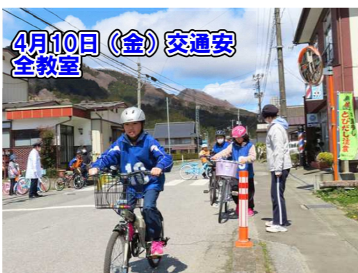
4月10日(金)交通安全教室

交通安全教室は、「命を守る大切な学習」です。交通ルールを守り、「自分の命を自分で守る」力を身に付けましょう。