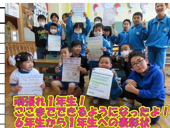
頑張れ1年生! ここまでできるようになったよ! 6年生から1年生への表彰状

この写真は、6年生から1年生に「こんなことができるようになったで賞」を贈ったときの写真です。