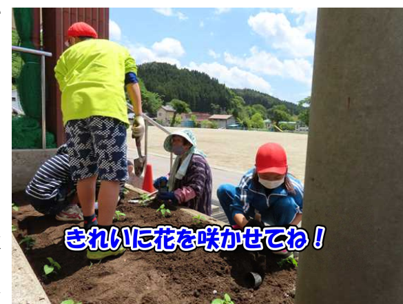
きれいに花を咲かせてね!

漢字レース、算数レースは、朝学習の時間に行っています。職員室から「よいいはじめ!」の放送とともに各教室カリカリと鉛筆の書く音だけ響きます。緊張感も伝わってきます。全員が100点になるまで取り組みます。確かな学力は、「一日してならず」一日一日の取組を大切に自分の目標に向かって頑張る子どもを育てていきます。