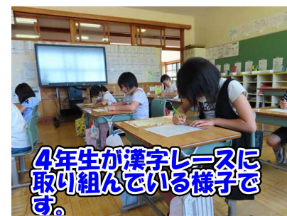
4年生が漢字レースに取り組んでいる様子です。

横田小学校では、5月、6月、9月、10月、11月、2月に漢字レース、算数レースを行っています。これは、基本的な学力として漢字を書く力、算数の力を確かに身に付けることをねらいとして行っているものです。