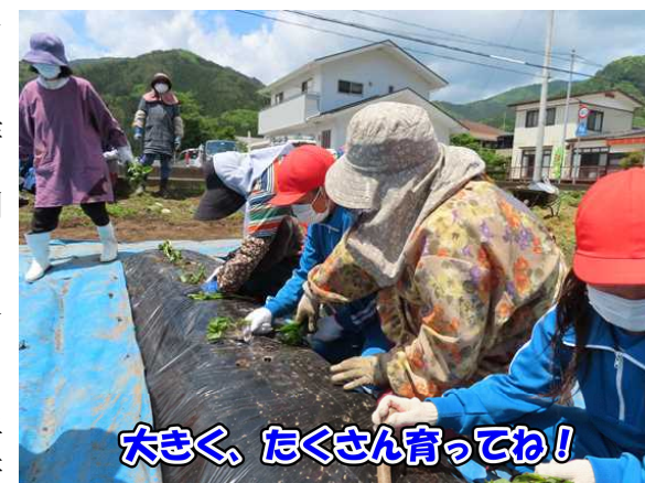
大きく、たくさん育てね!

いつもは、苗植えが終わった後に子どもたちから長生クラブの方へ肩もみサービスをしています。残念ながら今年は、コロナ対策でできませんでしたが、終わりの会での学年代表の感謝の言葉で長生クラブの方に感謝の気持ちを伝えることができました。今、各学年で感謝のお手紙を書いています。後日、長生クラブにお届けする予定です。