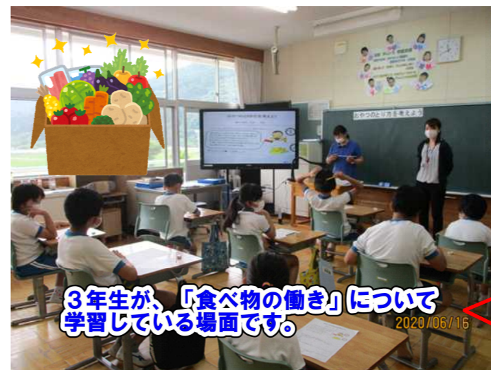
3年生が、「食べ物の働き」について学習している場面です。