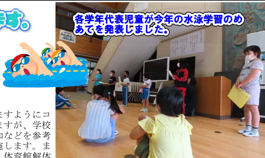
各学年代表児童が今年の水泳学習のめあてを発表しました。

すでに学校より、お知らせしていますように新型コロナウイルス感染の影響も心配されますが、学校医からのご指導、市教委、文科省通知などを参考に感染予防に配慮し、水泳学習を実施します。また、旧横田小学校校舎仮設住宅解体、体育館解体に伴い、水泳の際の着替えは学校で行います。準備するものなど詳しくは、学年通信等でお知らせします。ご協力をお願いします。