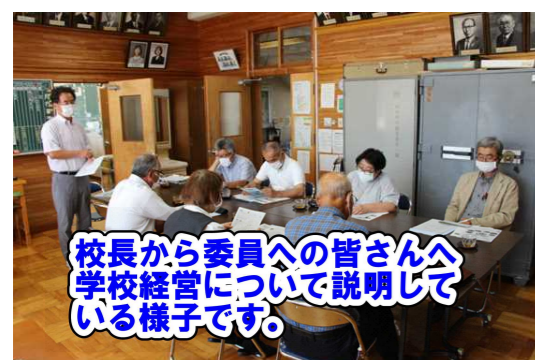
校長から委員への皆さんへ学校経営について説明している様子です。

昨年度まで「開かれた学校づくり推進委員会」として学校教育についてご意見、ご支援をいただいていた組織に変わり、今年度から「学校運営協議会」が発足しました。委員の皆様は、以下の通りです。(敬称略、副委員長以下名簿は、順不同です。)