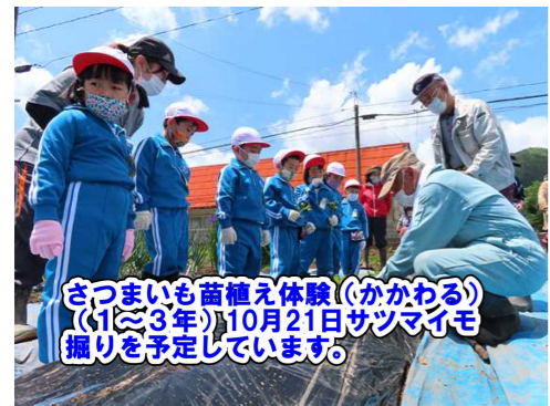
さつまいも苗植え体験(かかわる) (1～3年)10月21日サツマイモ 掘りを予定しています。