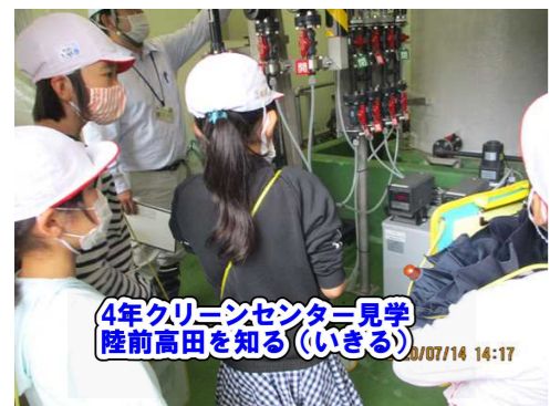
4年 クリーンセンター見学 陸前高田を知る(いきる) 2020/07/14 14:17