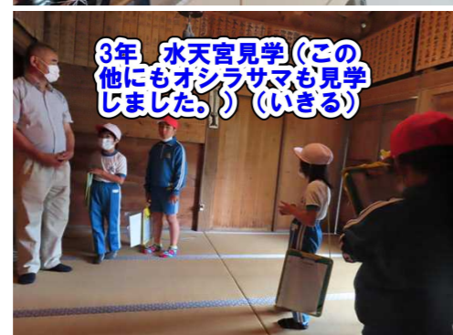
3年 水天宮見学(この 他にもオシラサマも見学 しました。)(いきる)