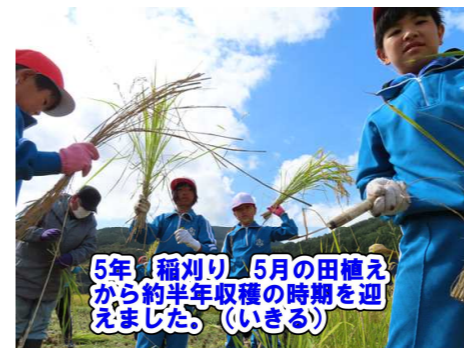
5年 稲刈り 5月の田植えから約半年収穫の時期を迎えました。(いきる)

ふれあい交流会(サツマイモ掘り、花植作業)は、地域の方とのつながり、かかわりを、3年生、4年生は、横田町、陸前高田を知る学習、そして、6年生は、陸前高田市の震災を知るとともにそのときの様子を合わせて知ろうとする学習です。どれもがふるさととかかわり、学ぼうとする学習・活動です。特に6年生は、平成23年3月11日にこの横田地区で起こった東日本大震災について地域、市役所の方など7名の方からお話を聞くことができました。横田地区の震災を知るとは、子どもが震災を事実としてとらえ、横田や陸前高田の未来につなげていくための貴重な機会となるはずで。