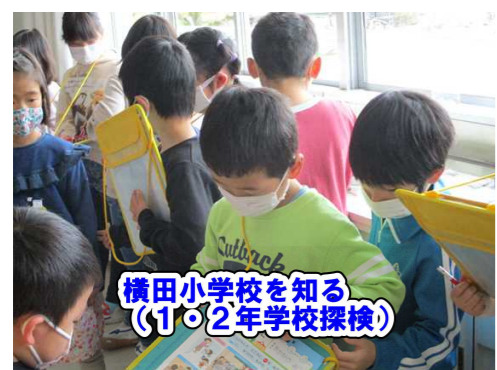
横田小学校を知る (1・2年学校探検)