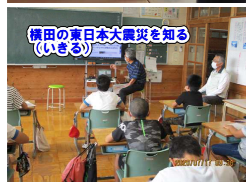
横田の東日本大震災を知る (いきる) 2020/07/17 09:30

1年生にとっては、身近な学校を知ることが地域を知るスタートとなります。避難訓練は、復興教育(そなえる)と関連させて行う活動とし、ふるさと学習の大事な活動として位置付けています。(過去の震災ともリンクさせることでふるさと学習としての価値付けを行っています。)