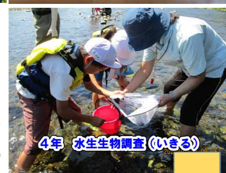
4年 水生生物調査(いきる)

担任としての思いは、この発表を通して、「 一つしかない命を大切に育てること 」そして「 わたしたちがすむふるさと横田、陸前高田のすばらしさを子どもたちに気付かせること 」そして、「 そのすばらしさをみなさんに伝えること 」です。