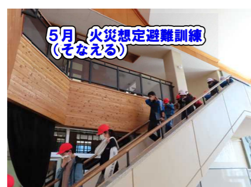
5月 火災想定避難訓練 (そなえる)