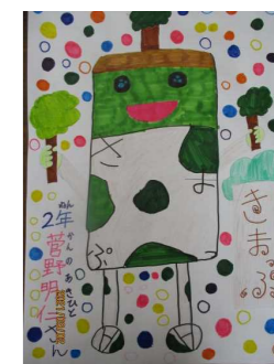
2年生 あきひとさんの作品