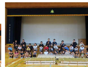
みんなで作ったいかだ